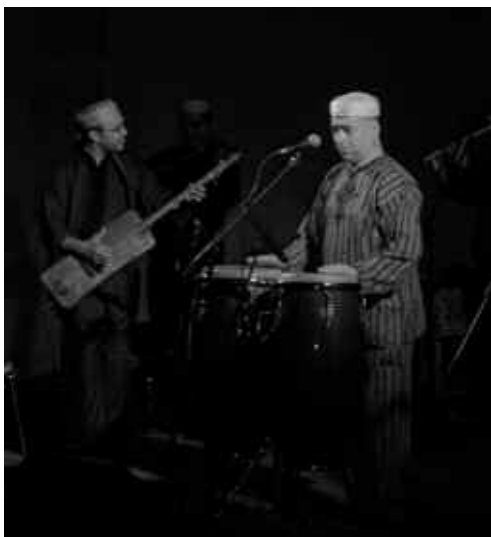
Concert Músiques del Món.

El col·lectiu Ripollet Rock organitza el cicle Rock'n'video, que té lloc al Casal de Joves, i el Festival Ripollet Rock, que contribueix a la difusió de les bandes locals adreçades a un