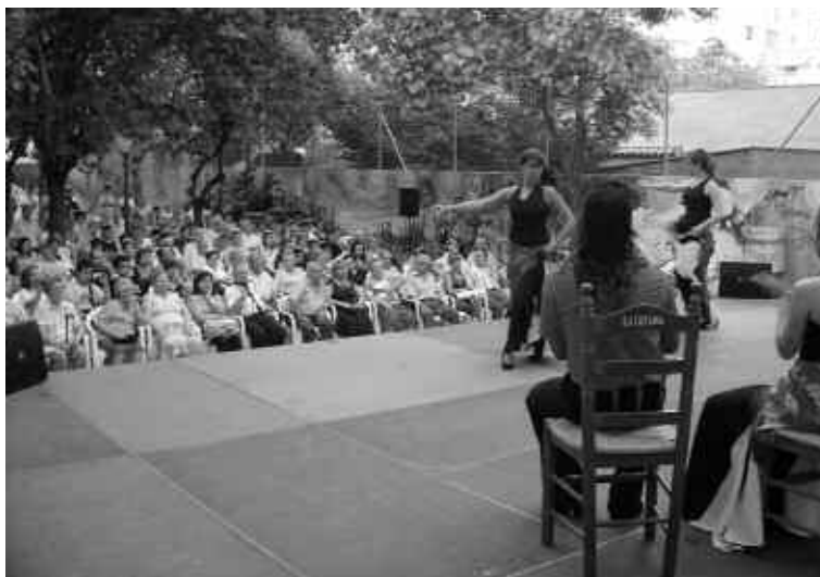
Estiu al carrer. Festival Peña Flamenca La Macarena.

A més, l'espai públic és el gran cohesionador els caps de setmana i festius de la població nouvinguda i reflecteix la diversitat de la població de Ripollet que de dilluns a divendres viu la diàspora del treball i l'escola fora del municipi.