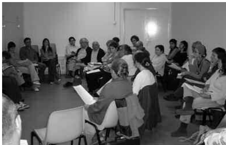
Reunió d'una taula de treball.

El conjunt del Pla d'acció cultural s'ha desenvolupat d'abril del 2005 a l'octubre del 2006.