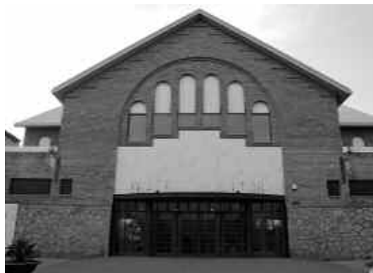
Façana del Teatre Auditori.

Si bé aquests paràmetres no poden ser presos al peu de la lletra, atès que són uns estàndards de referència que caldria, a més, que s'adaptessin a la realitat cultural de cada municipi, sí que poden ser un bon punt de partida per contrastar la situació dels equipaments culturals de Ripollet.