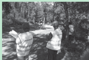
Els voluntaris fent tasques d'avituellament i neteja de la XXI Cursa del Castell de Montesquiú.

Recull de les activitats dels propers mesos 7