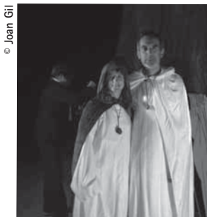
Durant la Nit al Parc, dos voluntaris es van transformar en druída i en dama celta.

El dissabte 1 d'agost es va celebrar la tradicional Nit al Parc, la Festa al parc a Santa Fe de Montseny, dins del programa «Viu el parc». Enguany la temàtica era el món celta. Des de l'any 2002 el voluntariat del Cercle hi ha estat present molt activament, fent possible la realització d'aquesta nit, ja que a causa de les característiques de l'indret i l'afluència de públic hi ha moltes tasques a fer i calen moltes mans disposades a ajudar. Abans ja s'havia participat en aquesta festa major, en el seu format anterior, els anys 1995, 1996 i 2000, és a dir que aquesta ha estat l'onzena edició.