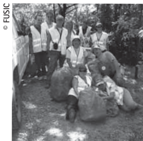
Un grup de voluntaris van ajudar a l'organització de la Cursa del Castell de Montesquiu.

Cap a la una de la matinada la vetllada artística va finalitzar i va començar la feina de recollir-ho tot i tornar a deixar el recinte tal com l'havíem trobat al matí.